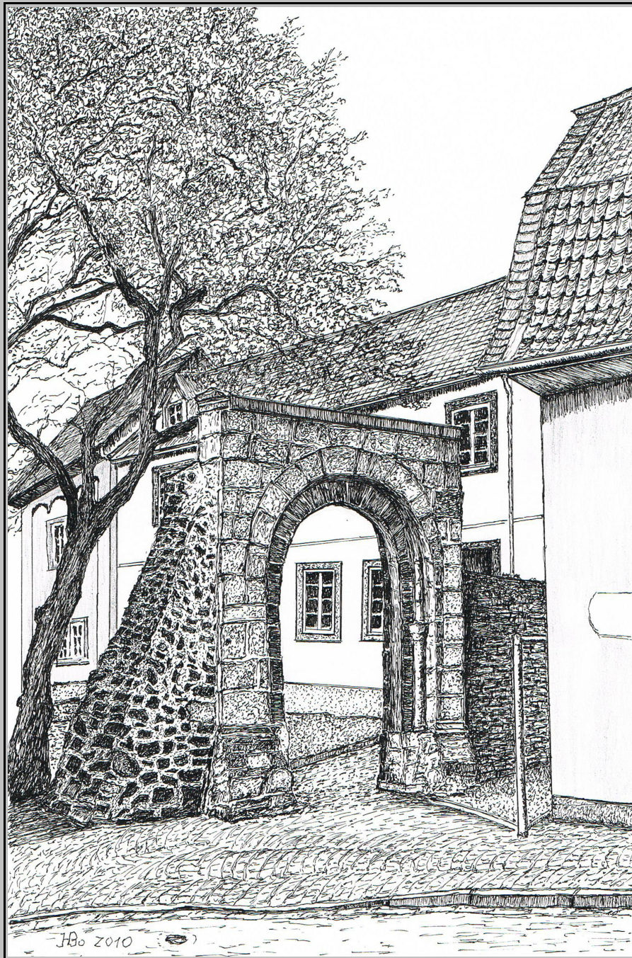
Vilich – Romanischer Torbogen, Zugang zur Schule und zum Friedhof