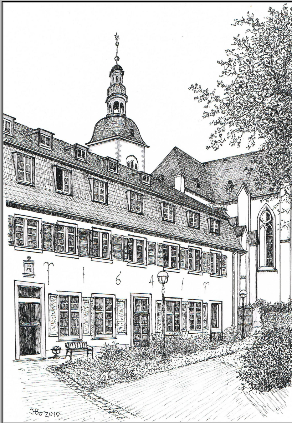
Stift Vilich, das ehemalige Stiftsgebäude von 1641