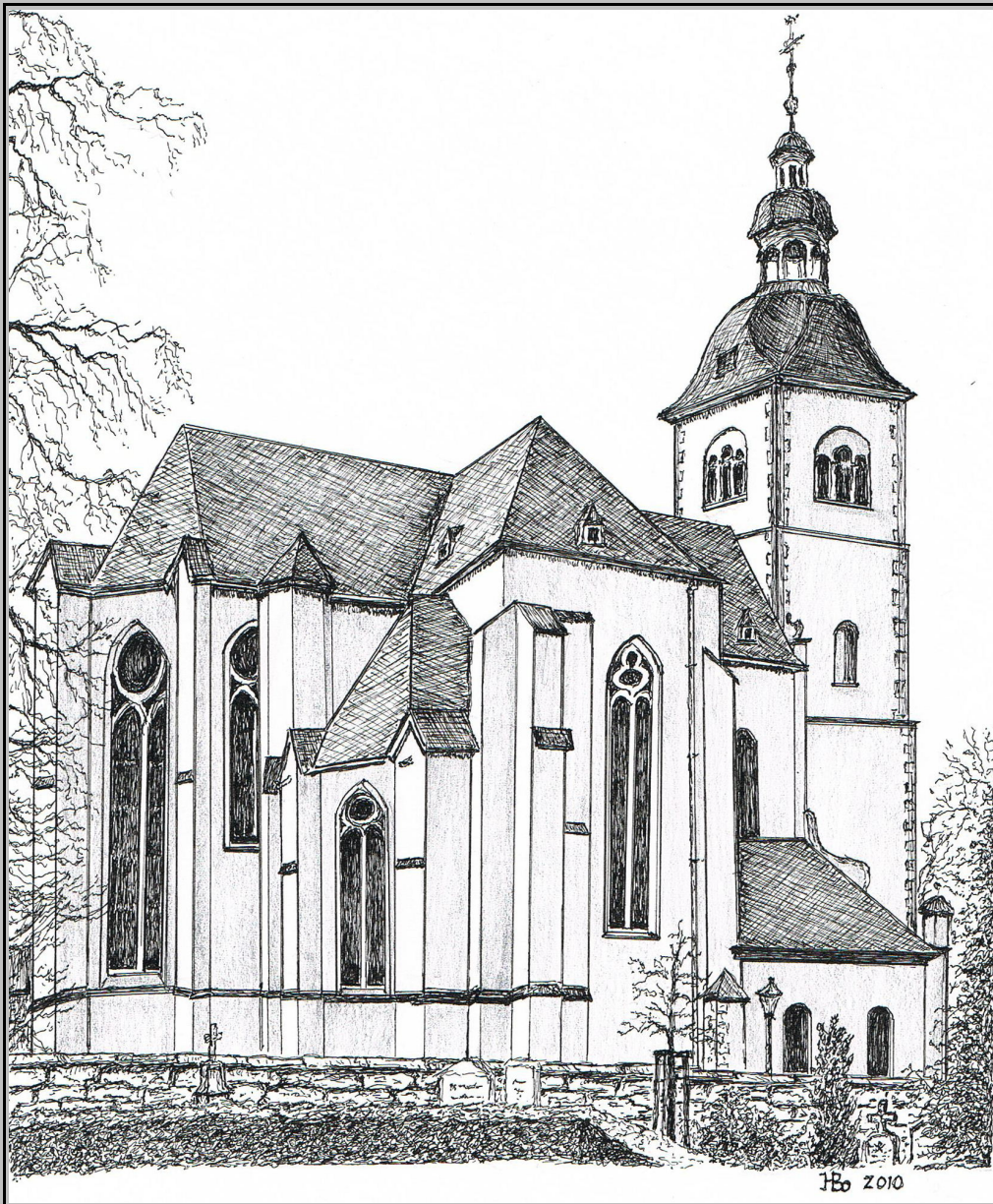
Die ehemalige Stiftskirche St. Peter zu Vilich